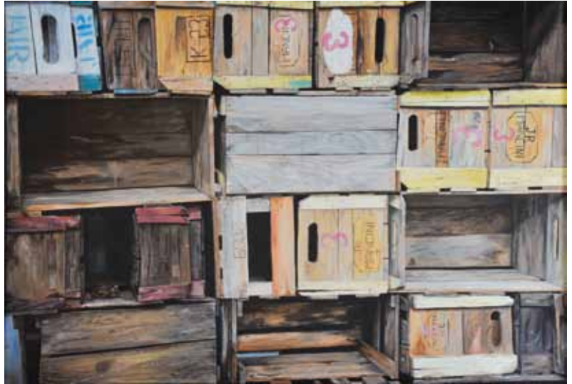
Mercado de Santo Amaro. Acrílico sobre tela. 150 x 103 cm