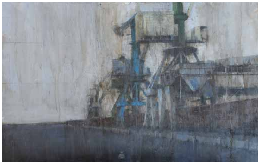
Sin título. Mixta / cartón / tabla. 92 x 146 cm