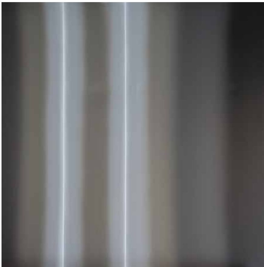
Tres mentiras. Acrílico sobre lienzo. 150 x 150 cm

Pintura A. Soria Vila de Benissa, Alicante