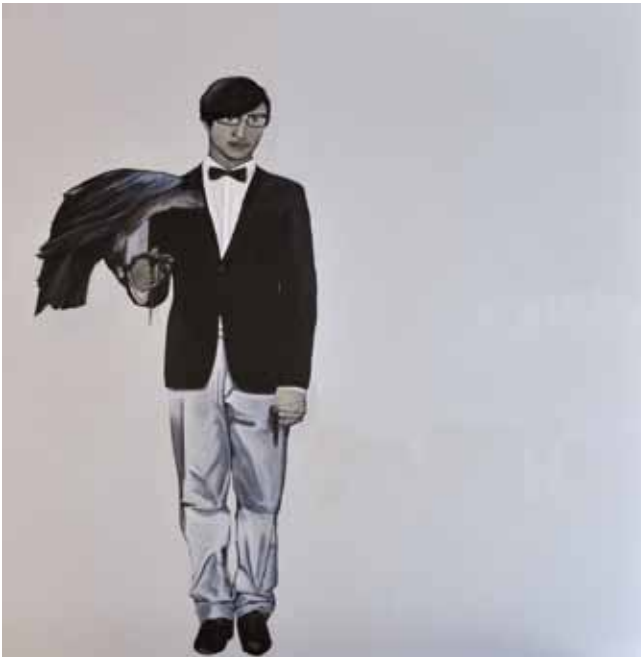
Último hombre en pie. Acrílico y óleo sobre tabla. 150 x 150 cm