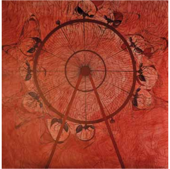
Vuelta al mundo. Óleo sobre tela. 150 x 150 cm