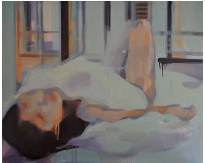
Morning , Óleo sobre tela. 100 x 80 cm