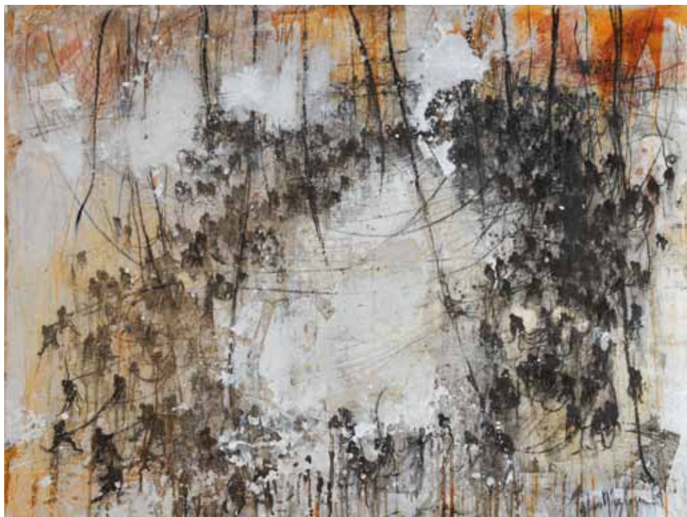
Espejismo de un Dios . Mixta-Lino. 146 x 114 cm