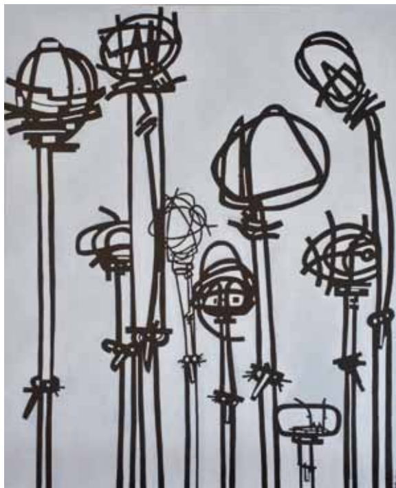
Sin título V. Acrílico sobre tela. 80 x 100 cm