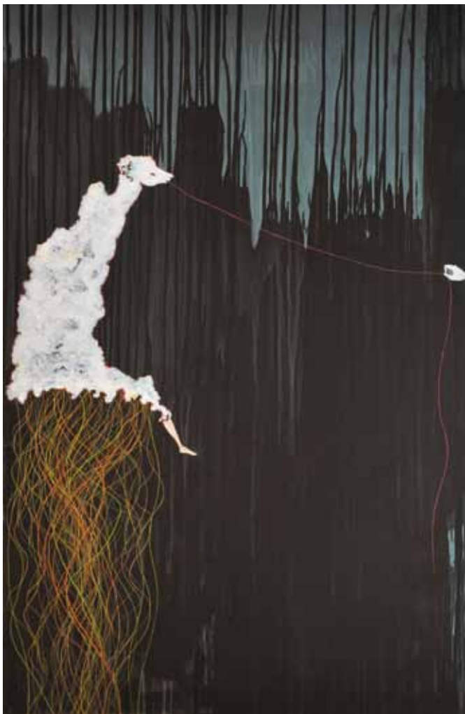
Fils . Mixta sobre fusta. 150 x 100 cm