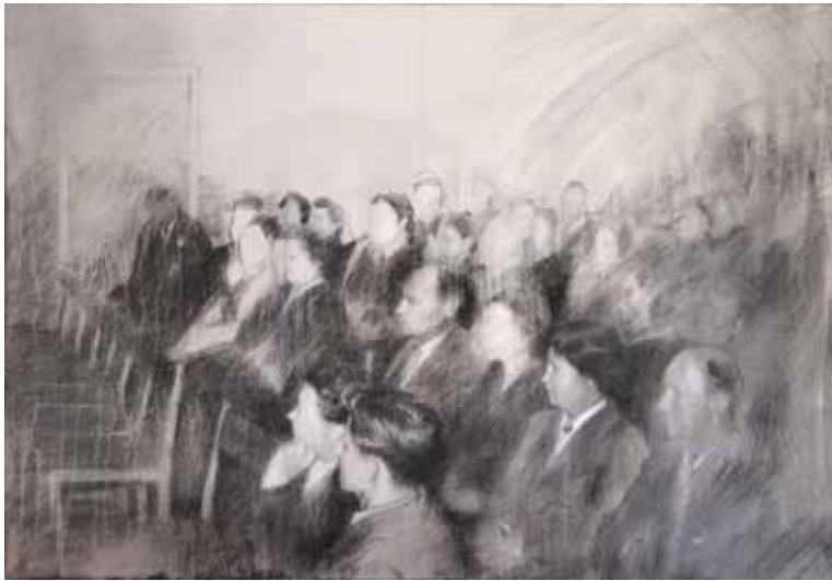
Discurs. Oli i acrílic sobre tela. 89 x 130 cm