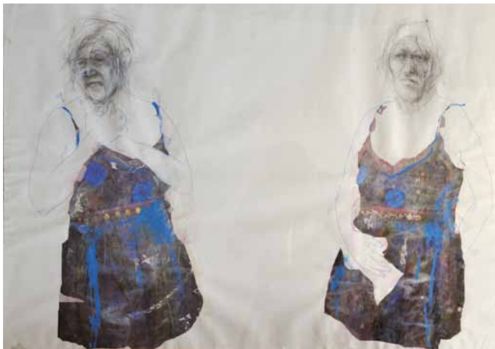
De la serie Dobles tonos . Técnica mixta. 110 x 80 cm

to "el arte de cada día") Sala de exposiciones del colegio GSD. Alcalá de Henares. Madrid