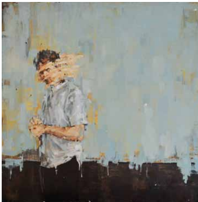
Amadeu. Óleo sobre madera. 122 x 122 cm