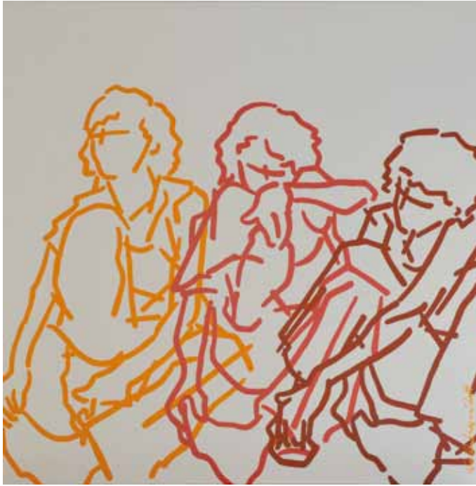
Moviment abstracte del cos. Acrílic. 130 x 130 cm