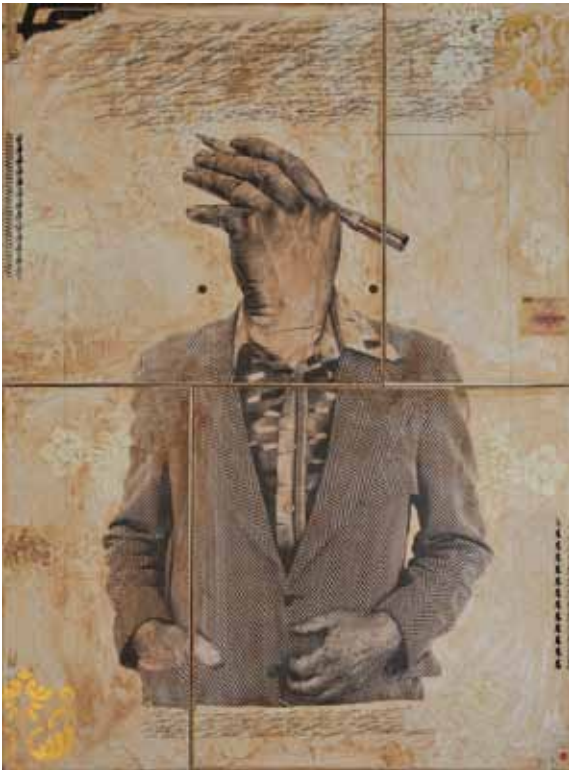
Manipulació. Mixta. 80 x 100 cm